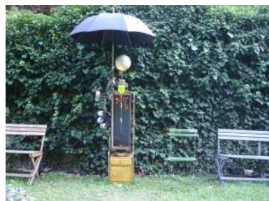
à l'ombre... du cerisier, Chalon dans la Rue 2008