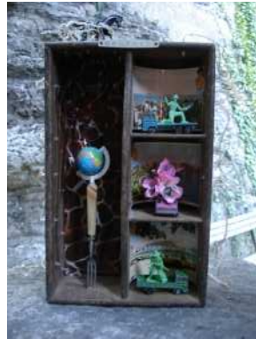
à l'ombre... du cerisier, Chalon dans la Rue 2008